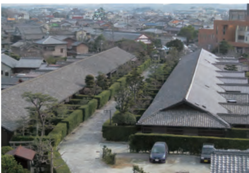
二ノ丸から見た御城番屋敷

スタンプ 設置場所 歴史民俗資料館内にスタ ンプを設置しています。 歴史民俗資料館 ■開館時間 9:00~16:30(4月~9月) 9:00~16:00(10月~3月) ■休館日 月曜日、祝日の翌日、年末年始 ※展示替えて臨時休館あり