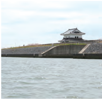
揖斐川からみた蟠龍櫓