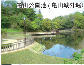
亀山公園池 (亀山城外堀)