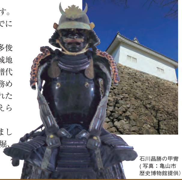
石川昌勝の甲冑

明治6年(1873)の廃城令により城内の建造物はその大部分が取り壊されましたが、現在は本丸東南隅の多門櫓(県有形文化財建造物)と石垣(県史跡)、外堀、二之丸から西出丸の北側の土居が良好な状態で残っています。また、発掘調査により発見された二之丸北埋門と帯曲輪が復原整備されています。