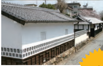
加藤家長屋門及び土蔵