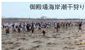
御殿場海岸潮干狩り