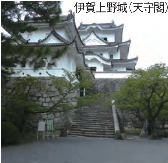
伊賀上野城(天守閣)