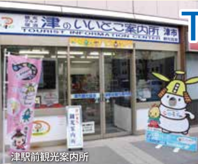
津駅前観光案内所