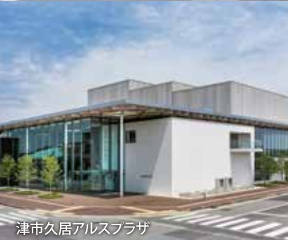
津市久居アルスプラザ