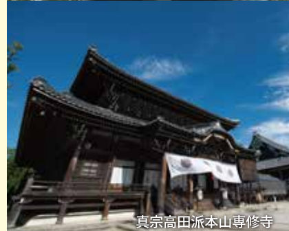
真宗高田派本山専修寺