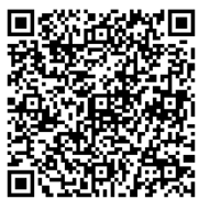
津市ホームページ QRコード