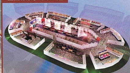
全国お菓子であい館

全国のお菓子を6ブロックの地域毎に展示し、 お菓子と地域との関わりを紹介 また、菓子関連の団体や企業の活動内容や商品を紹介