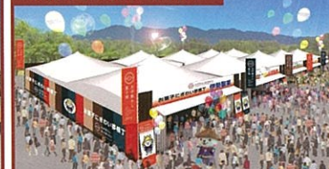
お菓子里ごわい夢横丁