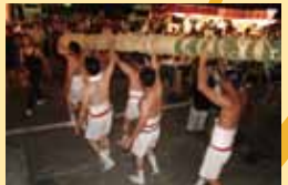
7月11日に白塚町八雲神社 で行われる「やぶねり神事」