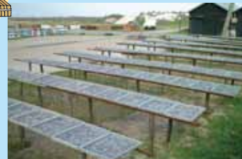
天日干し風景が広がります