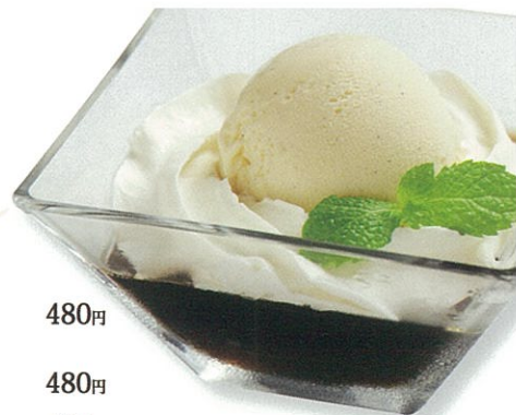
自家製珈琲ゼリー