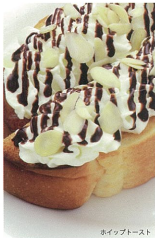
ホイップトースト