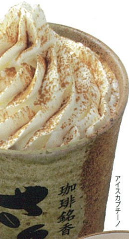
アイスカプチーノ