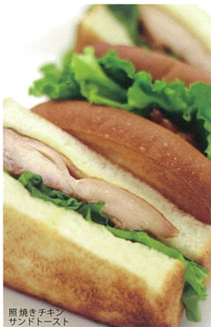
照焼きチキン サンドトースト