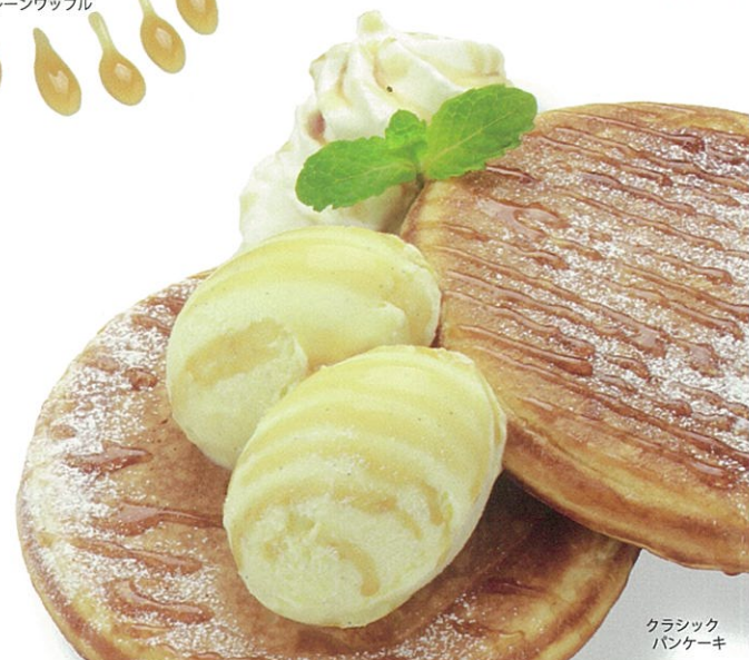
クラシック パンケーキ