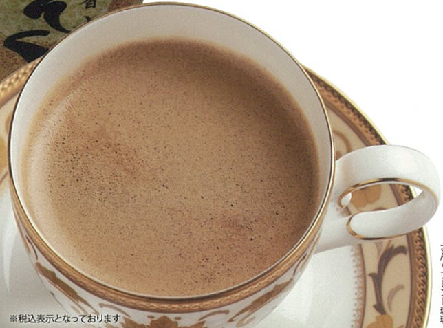
さんくブレンド珈琲