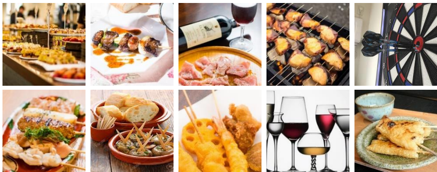
※写真はイメージです(2017年メニューなど抜粋)

津らのどまんなかバルは、日常的に「ちょい飲み」をたしなむスペインのバル文化になぞらえた企画です。お店巡りを通じて、いつもよりちょっといいこの街に、ちょっとずつ触れてみませんか。それは、あなたと街の物語。恋に落ちていくように。